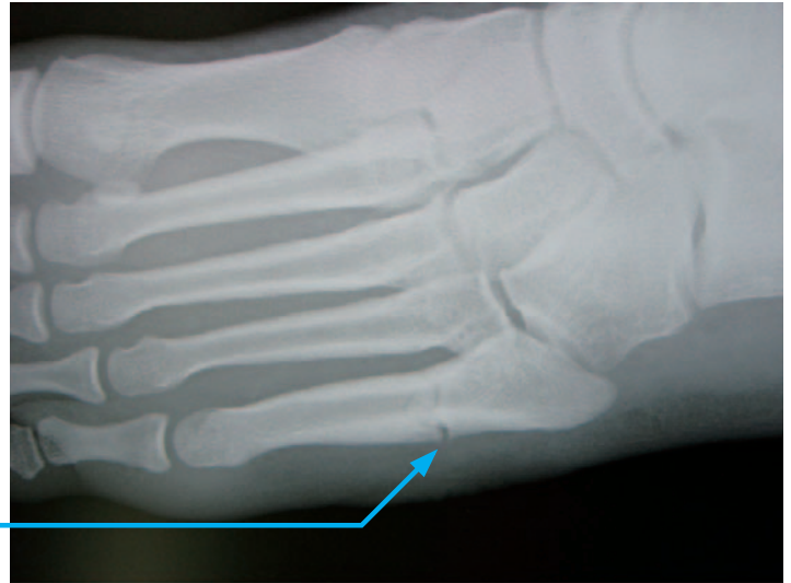
第5中足骨近位骨幹部疲労骨折例

X線撮影を行い骨折の部位や骨折の状態をみて診断します。MRI検査などを行う場合もあります。