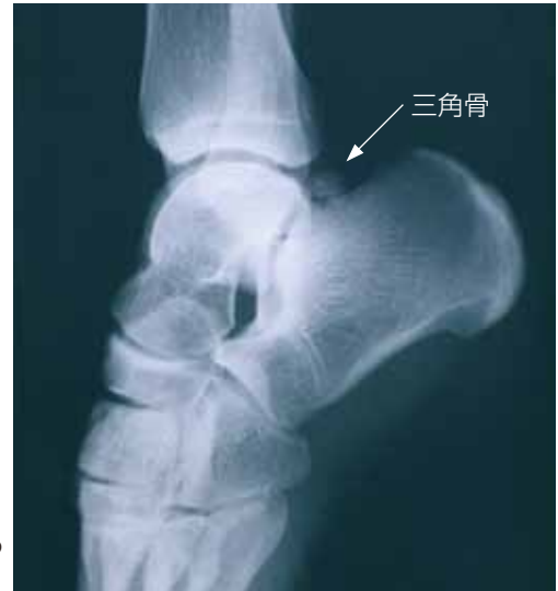
三角骨が原因と考えられる症例のX線写真